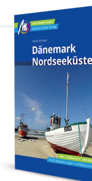
Heidi Schmitt: Dänemark Nordseeküste Inkl. Faltkarte 1:350.000, 8 GPS-Wanderungen und Radtouren Michael Müller Verlag 2020, 416 S, 19,30 €.

Ein konkretes neues Projekt ist noch nicht geplant, aber Dänemarks Ostseeküste und die dänischen Inseln sind auf jeden Fall die nähere Betrachtung wert.