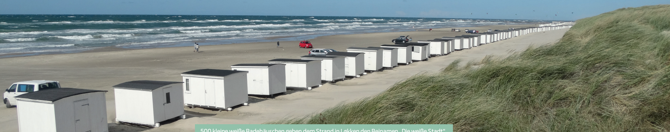
500 kleine weiße Badehäuschen geben dem Strand in Løkken den Beinamen „Die weiße Stadt“.