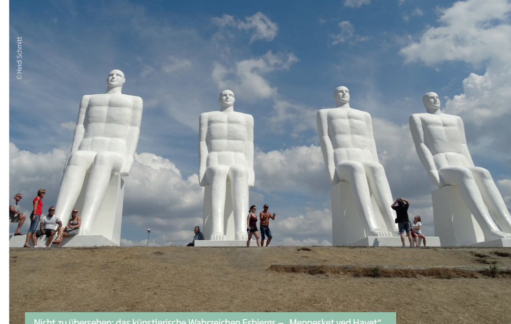
Nicht zu übersehen: das künstlerische Wahrzeichen Esbjergs – „Mennesket ved Havet“.